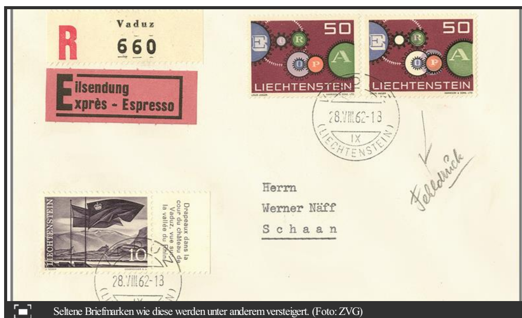
Seltene Briefmarken wie diese werden unter anderem versteigert.

Briefmarken sind in der heutigen Zeit nicht nur für Sammler, sondern auch für Investoren gesuchte Objekte: Als uralte Kulturobjekte sind sie begehrt, dokumentieren Geschichte und werden sogar als alternative Wertanlagen mit emotionalem Zusatznutzen gehandelt. Das ist auch bei den verschiedenen seltenen Briefmarken und Briefen aus dem Fürstentum Liechtenstein der Fall, die Ende Mai im Auktionshaus Rapp unter den Hammer kommen: Besonders sticht eine tadellos erhaltene, grüne 35-Rappen-Marke heraus, die vierseitig mit der speziellen 11 ½-Zählung versehen ist. Die Auflage in der Zähnung 11 ½ betrug lediglich 29 Stück. Entsprechend hoch wird die Marke geschätzt. Sie dürfte gegen 5'000 Franken wert sein. Weitere Raritäten sind ein Block mit seltenen Marken des in Liechtenstein geborenen Komponisten Josef Rheinberger sowie zwei Briefe mit fehlerhaften und deshalb seltenen Europa-Marken von 1961. Beide Lose dürften mehrere Tausend Franken wert sein.