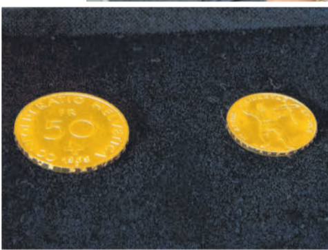
Das Goldmünzenpaar erzielte fast 100.000 Franken.

Gold-Einsteigern empfiehlt sie Kurantmünzen, also Münzen, deren Wert durch das Edelmetall nahezu vollständig gedeckt ist. Sie werden international gehandelt und können bei Banken gekauft und verkauft werden. Die Nachfrage nach Anlagemünzen wie Goldvreneli oder Krüggerrands sei in den letzten Wochen merklich gestiegen. Aber auch Sammelmünzen wie zum Beispiel das 100-Franken-Stück in Gold von 1925 würden sich großer Beliebtheit erfreuen. Seltene Goldmünzen hätten den Vorteil, dass es nicht