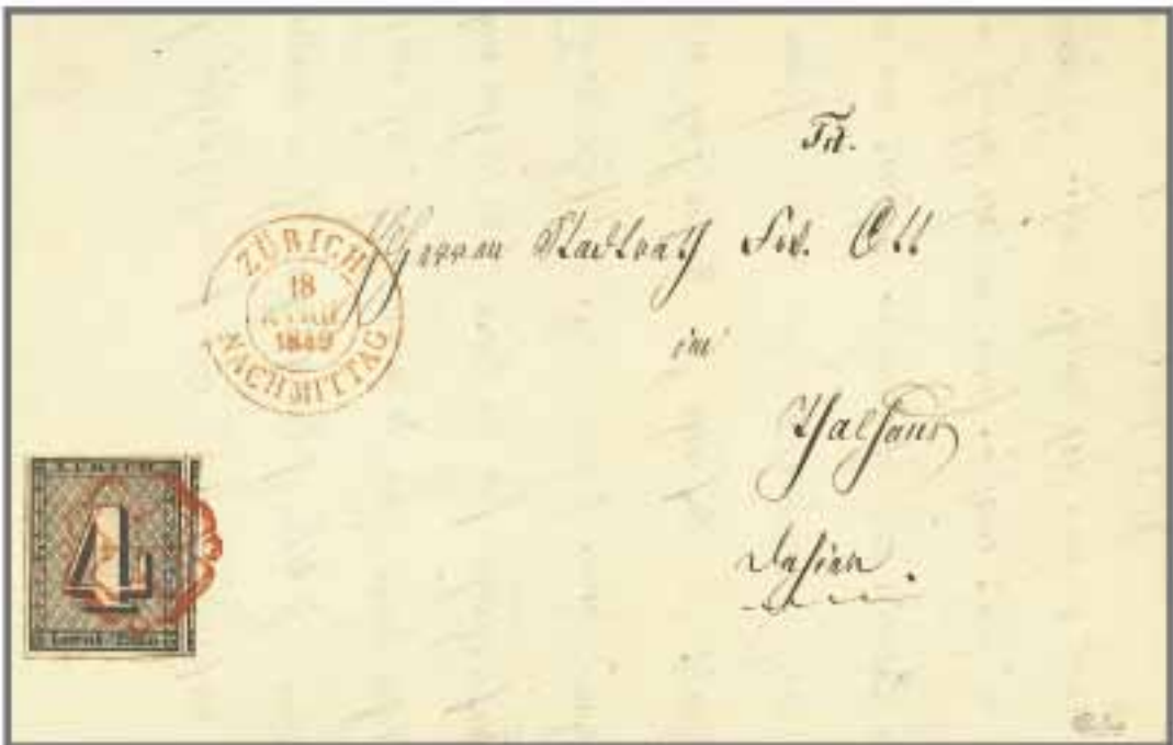
Los 511, Zuschlag 51'000.-