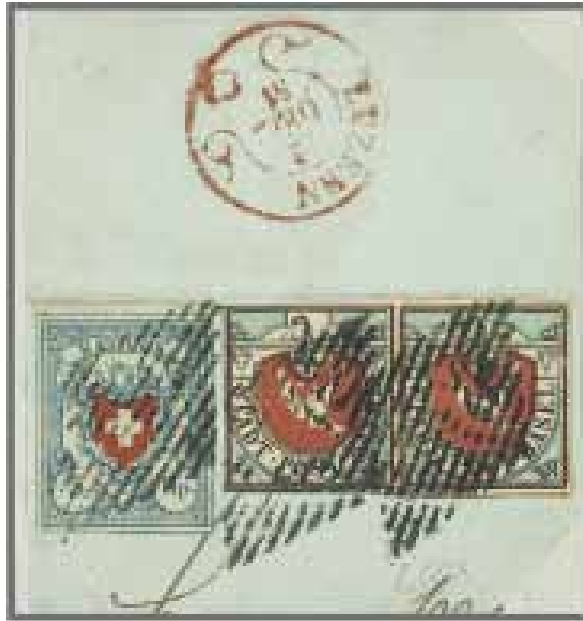
Los 114, Zuschlag 130'000.-