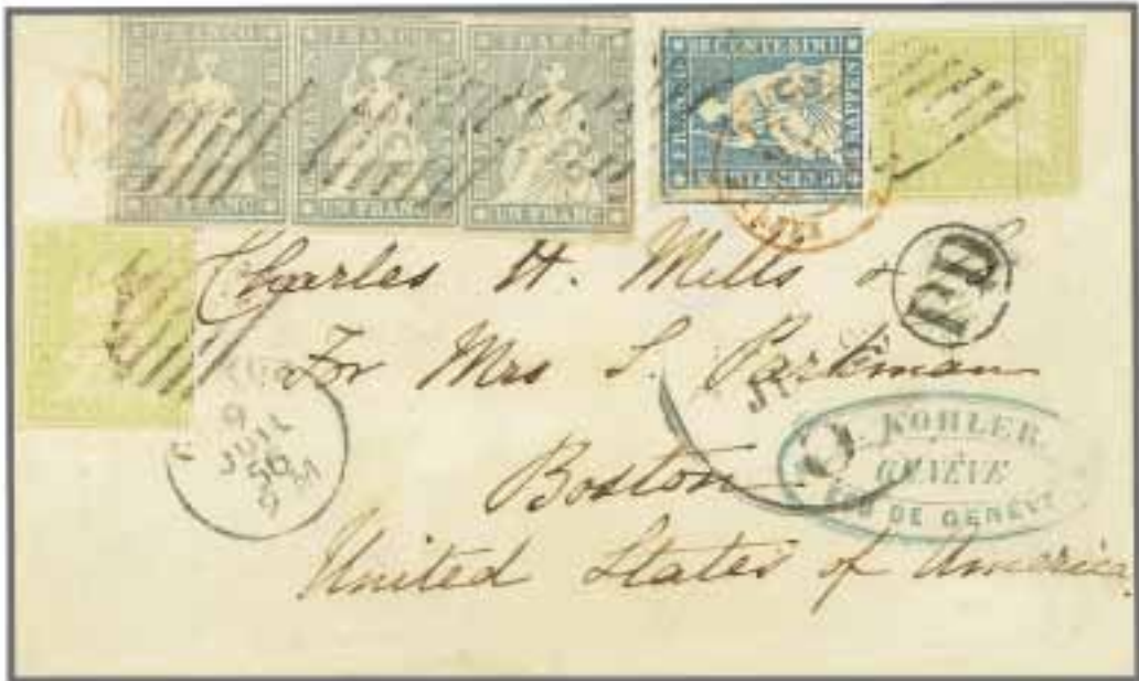
Los 911, Zuschlag 28'000.-