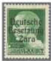
Los 1415, Zuschlag 8'700.-