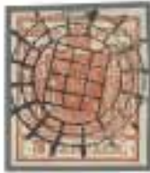
Los 1615, Zuschlag 1'700.-