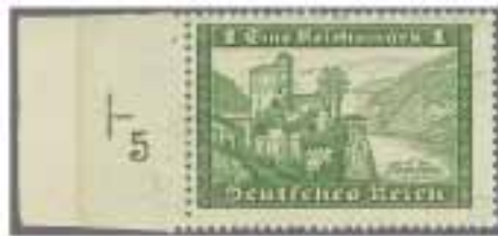
Los 1396, Zuschlag 10'000.-