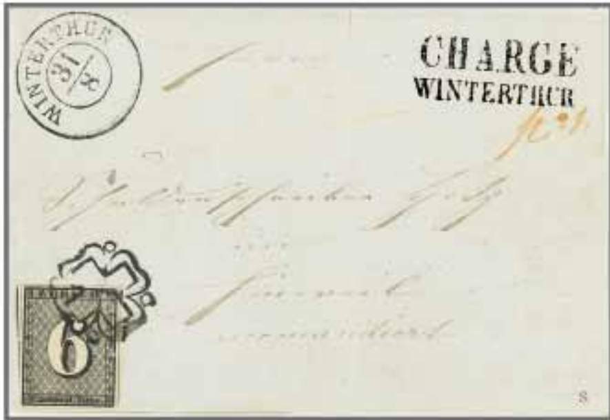
Los 518, Zuschlag 62'000.-