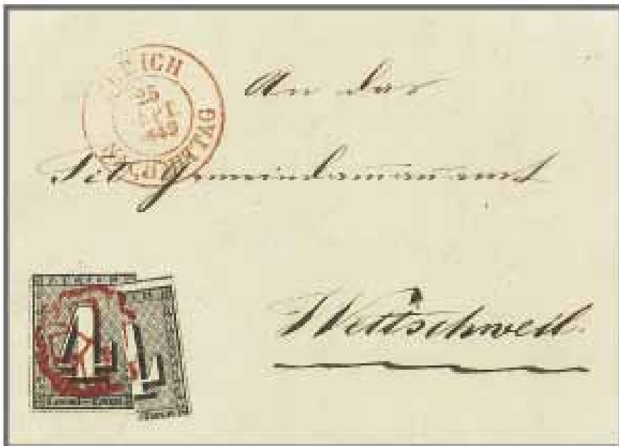
Los 11, Zuschlag 180'000.-