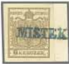
Los 1587, Zuschlag 1'800.-