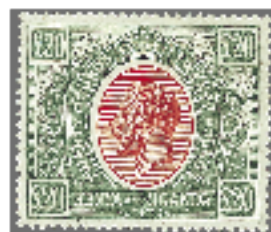
Los 1471, Zuschlag 16'000.-