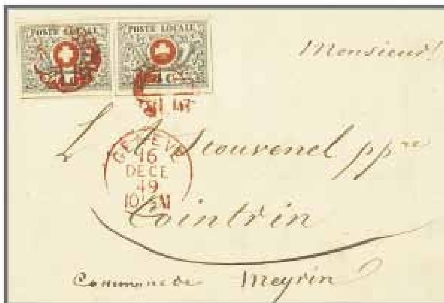
Los 123, Zuschlag 285'000.-