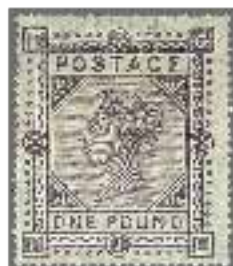
Los 1470, Zuschlag 21'000.-