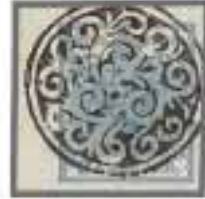
Los 1561, Zuschlag 2'200.-