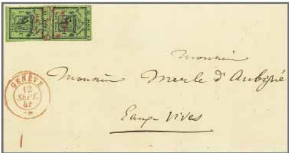
Los 58, Zuschlag 270'000.-