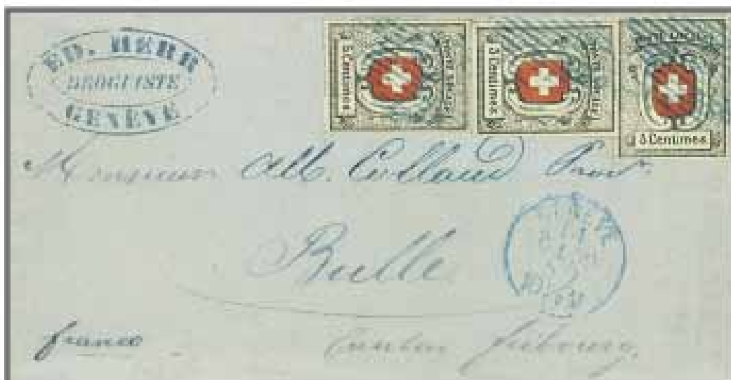
Los 154, Zuschlag 290'000.-