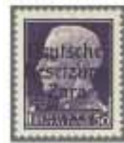
Los 1416, Zuschlag 19'500.-