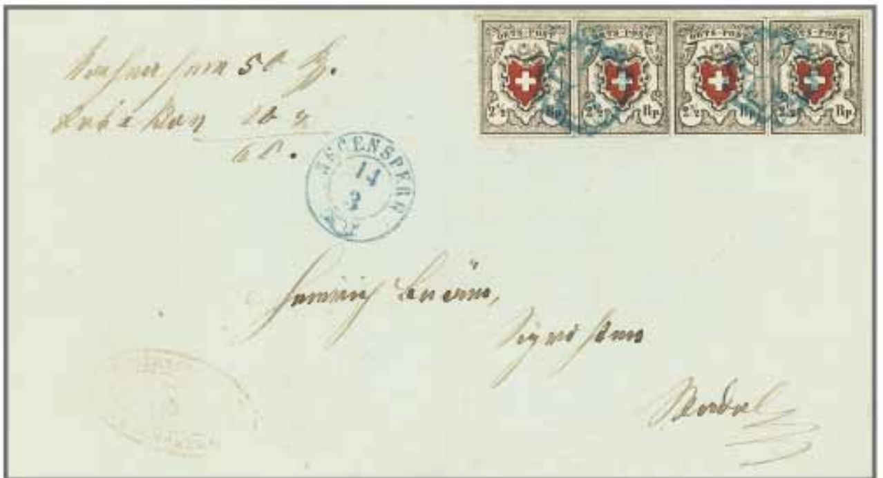
Los 182, Zuschlag 40'000.-