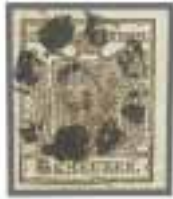
Los 1525, Zuschlag 2'400.-