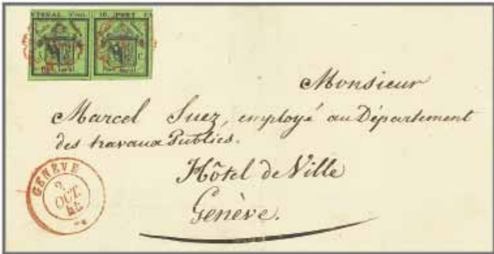
Los 56, Zuschlag 110'000.-