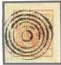
Los 1508, Zuschlag 2'000.-