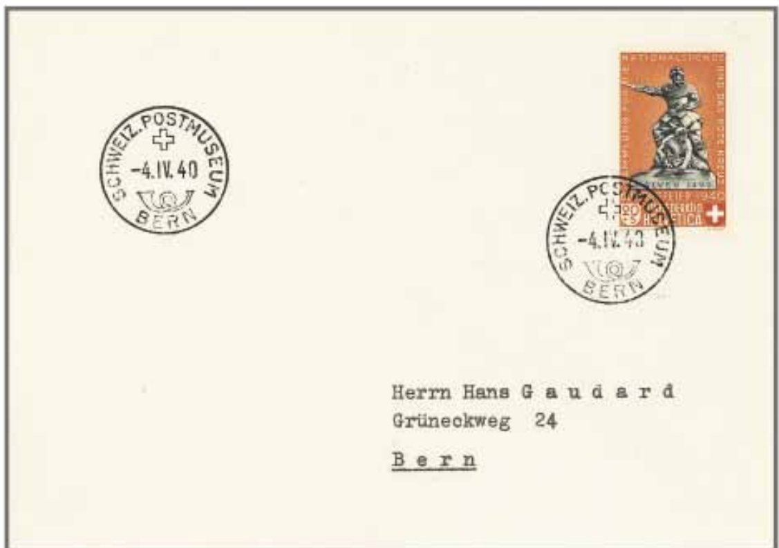
Los 1040, Zuschlag 21'000.-