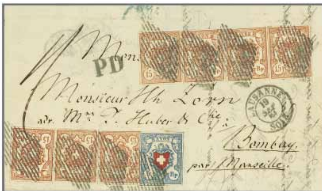
Los 400, Zuschlag 75'000.-