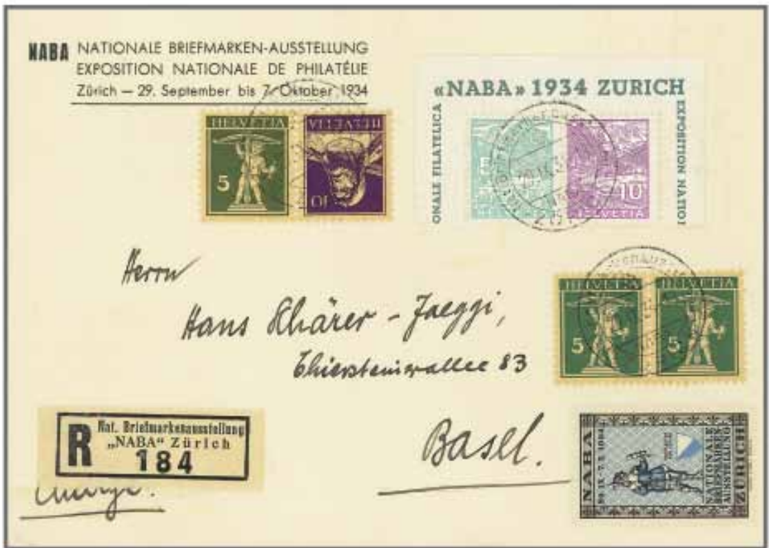
aus Los 984, Zuschlag 20'000.-