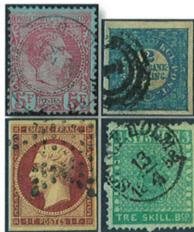
Spitzenstücke aus Monaco, Dänemark (obere Reihe), Frankreich, Schweden und Großbritannien (untere Reihe).

ten sechs Jahrzehnte nach Erfindung der Briefmarke sein oder die ersten hundert Jahre. Mancher zieht auch an einem der historischen Daten seine persönliche Grenze. In Mitteleuropa markieren die Jahre 1918, 1945 und 1989 Umbrüche, die zahlreiche Länder und damit Sammelgebiete trafen. Der Autor weiß aber auch von einem russischstämmigen Sammler, für den die Klassik – mancher wird jetzt sagen, die Semiklassik – mit dem Staatsstreik vom November 1917 endete. Die Moderne hat für