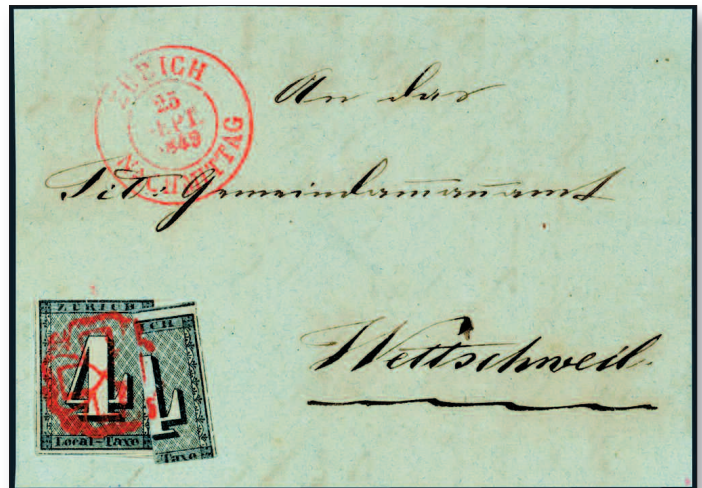
Kurz vor der Einführung des eidgenössischen Tarifs zum 1. Oktober 1849 waren in Zürich Aufbrauchsfrankaturen mit halbierten Marken möglich. Solche Belege sind noch seltener als Briefe mit Paaren oder Doppelfrankaturen.

Die Ticino-Sammlung besticht vor allem durch die herausragende Qualität des Materials. Ganz gleich, welche Seite man in den Alben aufschlägt, erblickt man stets Liebhaberstücke. Der namentlich nicht bekannte Philatelist trug sie im Laufe von rund 25 Jahren geduldig zusammen, ohne mit seinen Käufen Aufsehen zu erregen. An Auktionen hat er nie teilgenommen. Dementsprechend gering ist die Zahl der Belege und Marken, die in der philatelistischen Literatur bereits dokumentiert sind – schon immer gehörten die Kataloge der Auktionshäuser zu den wichtigsten Quellen. Oftmals erzählen sie mehr über die Philatelie und das Marktgeschehen, als