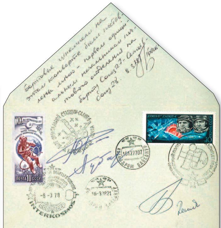
Kosmische Post: Brief vom ersten Postmaster im All, Georgi M. Gertschko.

Die Sammlung ist zwar in sich komplett, dennoch lässt sie Raum für den weiteren Ausbau. Weil sie in dieser Form nie wieder beschafft werden kann, ist sie prädestiniert für den Investor, Dokumentar-Philatelisten oder ganz einfach für den Astrophilatelie-Enthusiasten. Mit 200 000 Sfr Startpreis sind Sie dabei! hrc