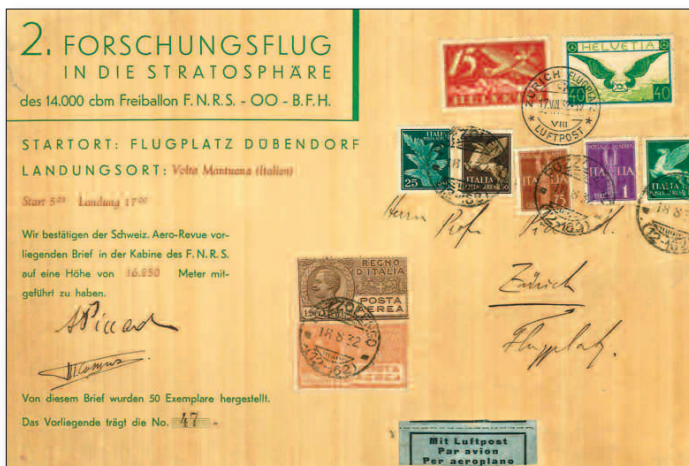
Weltraumtechnik: Ballonflug-Beleg von Auguste Piccard.

Beispielhaft für die bemannte US-Raumfahrt ist der Mondlandebeleg von Apollo-11 (20JUL69) mit Nixon-Unterschrift – bekanntlich begrüßte der US-Präsident die ersten Mondlande-Astronauten bei ihrer Rückkehr. Die Bachmann-Dokumentation enthält natürlich alle wichtigen Mercury-